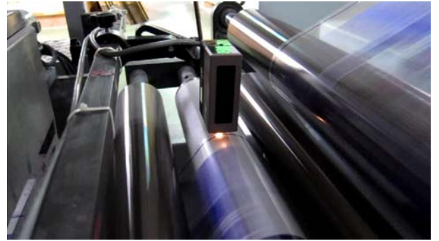
Renk Çizgi Sensör DLP-09 çizgi pozisyon kontrol üzerinde kullanılmaktadır.